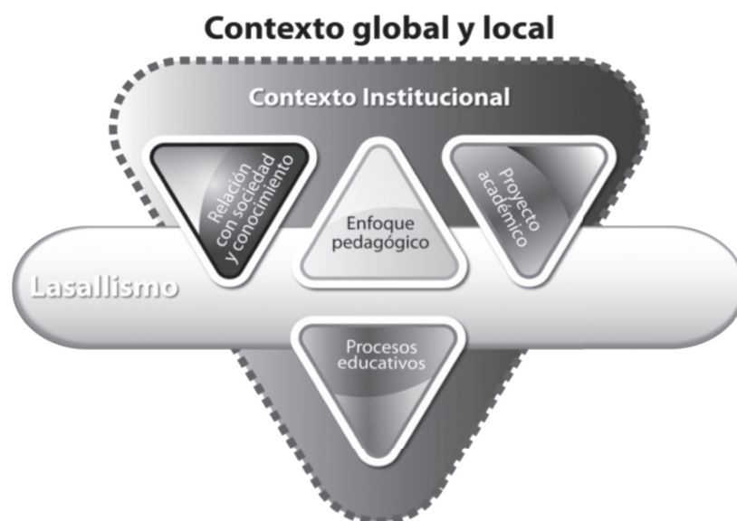
Gráfico 2. Elementos estructurantes del Modelo educativo de la ULSA. Creación de los autores.

Para ello el Modelo educativo integra cuatro elementos estructurantes que le permiten delimitar, fundamentar, planear, orientar y evaluar las políticas, el plan institucional, los proyectos, las estrategias y las acciones que dan cuerpo a sus funciones sustantivas y a la adjetiva, y se materializan en los ejes de gestión. Estos elementos, que moldean a la institución y la guían en su quehacer, son el enfoque pedagógico, la relación con la sociedad y el conocimiento, los procesos educativos y el proyecto académico.